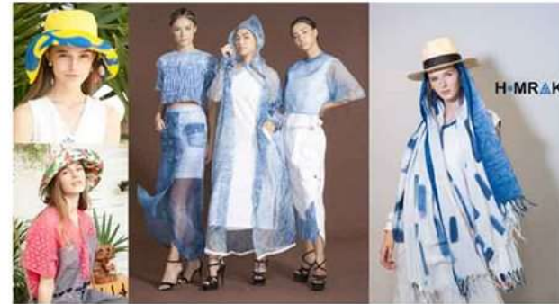
(LEFT) The trademark hats of Atipa sport a bright color on one side and a lively pattern on the reverse and Homrak is known for its one-of-a-kind indigo dyes across the entire collection.

Another clothing brand known for hand painting and traditional dyeing techniques is Homrak. The label is known for coming up with a variety of contemporary pieces and all in indigo.